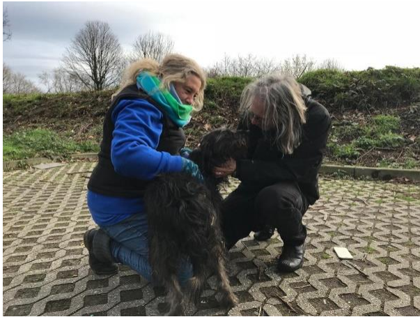
Angekommen: willkommen in unserem Leben

Bei vielen Menschen springen bei solchen Eckdaten Gedanken und Befürchtungen an: was stimmt mit dem Hund nicht? Es muss doch einen Grund haben, dass er so lange dort sitzt... bestimmt ist er total verkorkst, vielleicht aggressiv, hat noch nie im Haus gelebt und lernt das mit fast 6 Jahren bestimmt auch nicht mehr... vielleicht zerstört er alles, pinkelt überall hin, gewöhnt sich nie an die Leine? Oder ähnliches.