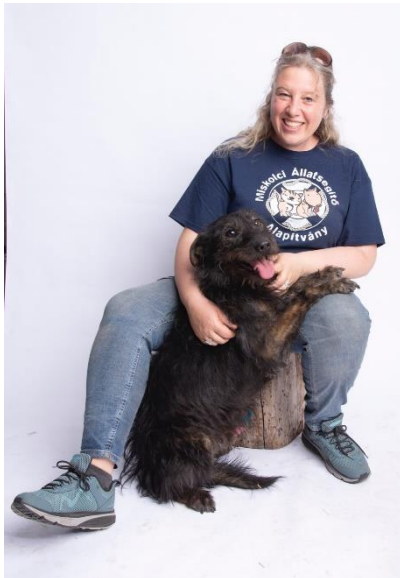
Erste Begegnung: Wookie und ich beim MASA-Fotoshooting.

Ich habe ihn auf meiner ersten Fahrt nach Ungarn im April 2019 kennen gelernt. Im Rahmen eines Fotoshootings hat uns das MASA-Team eingeladen, uns werbewirksam mit einigen Hunden, die schon lange auf ein Zuhause warten, professionell ablichten zu lassen. Unter anderem hatte ich dafür auch Wookie, der in Ungarn noch Stich hieß, ausgewählt (ich liebe halt die wuschligen Wolfswesen). Gute anderthalb Jahre später ist er dann bei uns eingezogen und hat unser Rudel vervollständigt - eine der besten Entscheidungen, die wir getroffen haben!