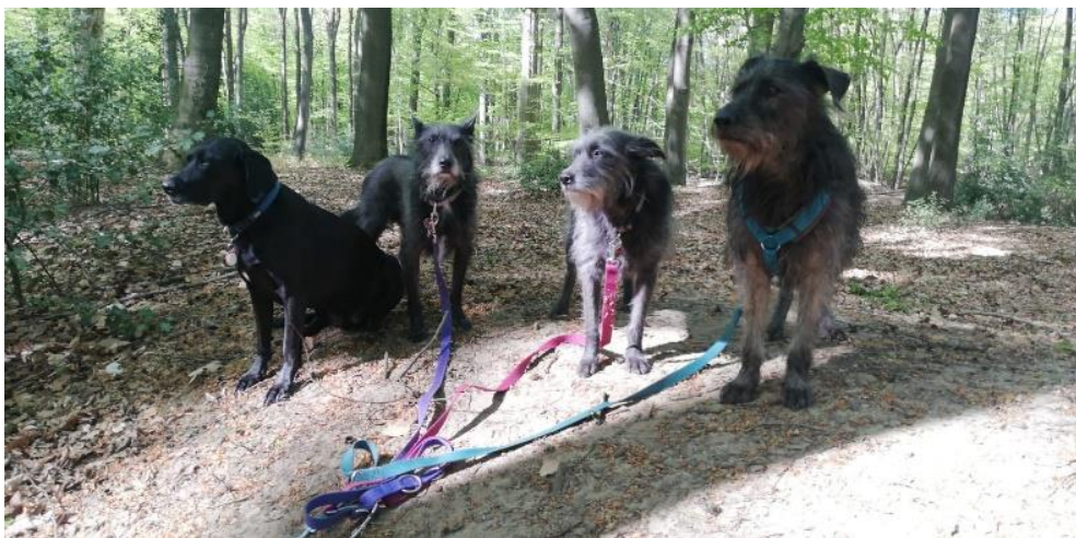
Wookie and the Gang

All diese Bedenken sind nachvollziehbar, natürlich ist all dies nicht auszuschließen, und es ist auch sinnvoll, sich auf gewisse "Übergangssymptome" während der Eingewöhnung einzustellen. Aber automatisch davon auszugehen, dass diese Hunde alle einen "Knacks" hätten, wird vielen "Langsitzer"-Hunden einfach nicht gerecht. Es warten so viele wahre, unkomplizierte, freundliche Schätze darauf, endlich, endlich entdeckt zu werden.