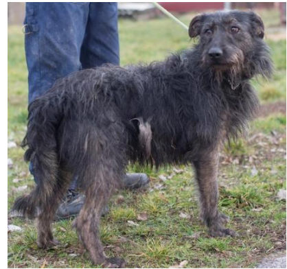
Wookie noch in Ungarn - ein optisch etwas wilder, leicht verwahrloster, aber wunderschöner Naturbursche

Ich möchte hier einmal eine Lanze brechen für all die Hunde, die viel zu lange, teilweise jahrelang, unentdeckt in den Tierheimen sitzen. Am Beispiel unseres Wookie, der seit Januar 2020 bei uns ist. All unsere Hunde warteten mehrere Jahre im Tierheim, bevor wir sie aufgenommen haben, aber Wookie musste am längsten darauf warten, entdeckt zu werden.