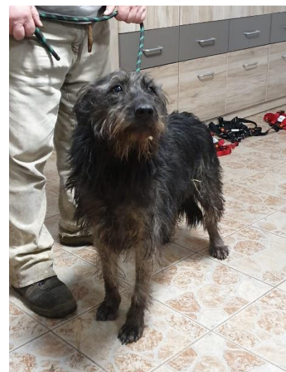
Wookie vor seiner großen Fahrt

Mit einer kurzen Unterbrechung über 5 Jahre, also eigentlich sein ganzes Leben, im Tierheim.